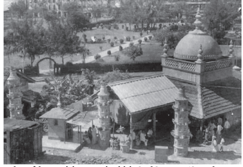
पाटीलबाईनी उभारलेले, मुळातले छोटेसे सिद्धीविनायक मंदिर, दीपमाळा, शेजारी उद्यान

या ठिकाणी कथानकाला एक सुरस वळण मिळते. दररोज समुद्रतळाशी ओतलेली सर्व दगडमाती सकाळी वाहून गेलेली असे. असे महिनाभर चालले. तेव्हा एकदा रामजी शिवजीच्या स्वप्नात येऊन देवीने दृष्टांत दिला की